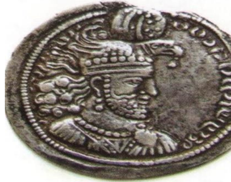
(شكل رقم ١١) درهم سك في عهد الملك هرمز الثاني يظهر فيه وهو معتمر (تاج طائر العقاب)

وَجُيِّدَت الفره بهيأة طائر على وجه درهم سَكُّ في عهد الملك هرمز الثاني (٣٠٣-٣٠٩م)، إذ يظهر الملك مُعتمراً التاج المعروف عليه بـ(تاج طائر العقاب). والمعروف أن أحد رموز الفره هو الطائر، بدلالة عند انتقالها من جمشيد كان أحد اشكالها الثلاث هو الطائر، فضلاً عن اعتلاء تاج الملك الشَّكل الكروي الذي هو رمز للفره أيضاً (ينظر: شكل رقم ١١).