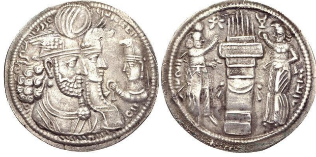
(شكل رقم ١٠) درهم يعود للملك بهرام الثاني ويظهر فيه الإلهة آناهيتا وهي تمنحه الحلقة الملكية

وَجُيِّدَت الفره بهيأة طائر على وجه درهم سَكُّ في عهد الملك هرمز الثاني (٣٠٣-٣٠٩م)، إذ يظهر الملك مُعتمراً التاج المعروف عليه بـ(تاج طائر العقاب). والمعروف أن أحد رموز الفره هو الطائر، بدلالة عند انتقالها من جمشيد كان أحد اشكالها الثلاث هو الطائر، فضلاً عن اعتلاء تاج الملك الشَّكل الكروي الذي هو رمز للفره أيضاً (ينظر: شكل رقم ١١).