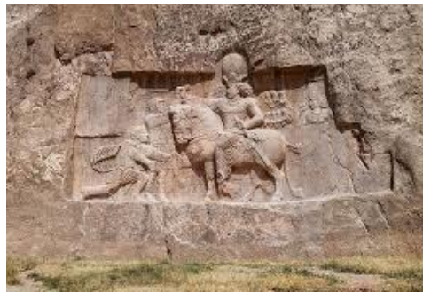
(شكل رقم ٥)

وفي نقش آخر من نقوش رستم يظهر الملك الساساني شابور الأول، وهو على صهوة جواده متمنطقاً بالسيف، ومعتماً التاج الملكي المزين بالكرة التي هي في الراجح تدل على الفره، ويبدو في الصورة استسلام الإمبراطور الروماني فاليريان، وتحت حصان الملك سابور جسد الإمبراطور جورديان الثالث، وإلى جواره صوّر النّش الاباطرة الرومان فيليب العربي، وفاليريان راكعاً أمام الملك شابور الأول (ينظر: شكل رقم ٥). وهنا يُراد من النّش بلاغ إعلامي من أن تحقيق الانتصار الملكي كان بفضل التّوفيق الإلهي (الفره) التي منحها أهوارامزدا للملك.