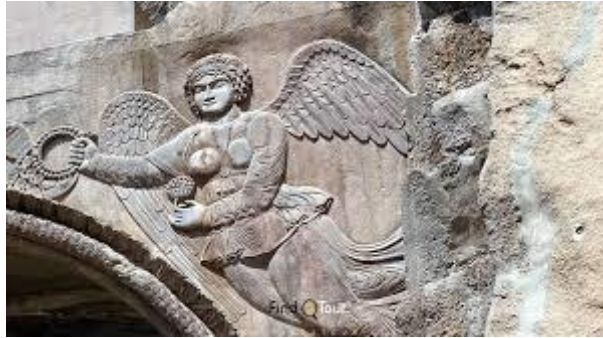
(شكل رقم ٨) مُوتيفة تمثل ملاك النَّصْر حاملاً حلقة مُجنّحة ترمز للتوفيق الإلهي

وهناك مُوتيفة (موضوع زخرفي) يشغل قمّة عقد المدخل في واجهة الكهف الساساني الأوسع في طاق بُستان، تُمثّل ملاك النَّصْر مُعتمراً بإكليل النَّصْر، قابضاً على حلقة مُجنّحة ترمز إلى القُوّة والنَّصْر (ينظر: شكل رقم ٨). وترمز أيضاً للغره (التّوفيق الإلهي) الداعمة للملوك الإيرانيين القدماء.