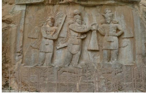
(شكل رقم ٦) مشهد تتويج الملك أردشير الثاني من قبل آهورامزدا وميثرا (من نقوش طاق بستان)

الإلهي)، فضلاً عن تدلّي الاشرطة المتموجة من تاجه التي ترمز إلى الرّيح أحد تجسّدات الغره، ونلاحظ أشعة الشّمس خلف الإله ميثرا التي ترمز للغره أيضاً التي حصل عليها هذا الإله بعد أن غادرت جسد جمشيد (ينظر: شكل رقم ٦).