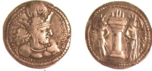
(شكل رقم ٩) درهم عائد للملك شابور الأول ويعلوه تاجه كره بهيأة شعاع ترمز إلى الفره

وبما أن المسكوكات تُعدّ واحدة من أبرز الأدوات الدعائية للسلالة الملكية، ولها أهمية كبيرة؛ لذا عملوا جاهدين في تجسيد مفهوم التفويض الإلهي ودعمه للملوك عليها، بحيث إن إحداث التغيير على نقوشها لا يفهم منه إلا أنه نتيجة لقبضة الموازنة على عنصر الفره، وفي أغلب الأحيان، التي يتعرّض فيها منصب الشاهنشاه عند التتويج واستبدال التاج للخطر، فإن عليه أن يثبت كفاءته وجدارته في أحقيقته بالفره أمام المؤسسة الدينية والعظماء في الدولة (الكعبي، ٢٠١٠، ص ٤٠٦). ومن النقوش المثبتة على العملات، على سبيل التمثيل: منها درهم يعود لعهد الملك شابور بن أردشير (الأول) (٢٤١-٢٧٢م) إذ صور الملك شابور الأول وهو معتمر التاج ويعلوه الكره بهيأة شعاع ترمز إلى الخورنه الفره أو هالة الألوهية التي تتوج رأس الملك، وفي ظهرها صورة للإله آهورامزدا (ينظر: شكل رقم ٩).