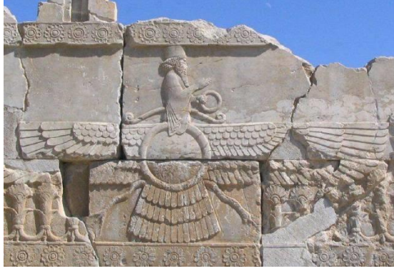
شكل رقم (١) المجسمة المجنحة

ويبدو أنَّ خصائص المنهج الزرادشتي في هذه المجسمة واضحاً، إذ إنَّ وجه الجوهرة مثلاً وجه إنسان جُيِّمَ بهيأة: كهل وحكيم وعارف، عليه دلالات الكبرياء، تتجلى فيه صفات الكبار والعقلاء والحكماء. أما الجناحان الظاهران في مكان الأضلاع، ففي كل جناح ثلاثة صفوف من الريش، فهي تمثل (الفكر الصحيح والعمل الصحيح والقول الصحيح)، وفي أسفل جسد الجوهرة ثلاثة أقسام من الريش النازل إلى الأسفل مثل الذيل، وهي دلالة على الفكر غير الصحيح، وعلى القول والعمل غير الصحيحين (ياقري، ١٣٩١، ص ١٢٠).