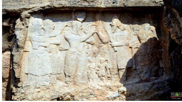
شكل رقم (٢) تتويج الملك أردشير بابگان من قبل الإله آهورامزدا

وتتجلى الفره (التوفيق الإلهي) الممنوحة للملوك الساسانيين، التي تُسَمُّ للملك على شكل حلقة، هي رمز الملوكية والتفويض الإلهي للملك، هذا ما خلفته لنا الكتابات والرسوم وآثار كثيرة دالة على الفره، بما يؤكد سمو مقامها في المعتقدات الدينية، وتوظيفها سياسياً من قبل ملوك الدولة الساسانية، فمن جملة هذه الكتابات والمجسمات، النقوش الملكية، إذ هناك منحوتتان حجريتان في نقش رجب***** الأولى: تجسد التتويج المقدس للملك الساساني أردشير بابگان، فصوّر الإله آهورامزدا وهو يمنح الملك أردشير التفويض الإلهي، إذ ظهر هذا الإله وفي يده اليمنى الحلقة الملكية وفي يده اليسرى الصولجان، والدالة على تقديم شارات الملوكية تلك إلى الملك والأخير رافع يده اليسرى وسبابته تُشير نحو الأمام في إيحائه لتبجيل الإله، ويده اليمنى تمتد بخشوع نحو الإله؛ لاستلام الحلقة الملكية منه، ويبدو منظر الخشوع واضحاً في هذه الوضعيّة، وإلى جانبه طفلان يحتمل أن يكون أحدهما هرمز الأول وهرمز الثاني وليّ عهده، والملفت للنظر هو انتهاء غطاء رأس الملك بشكل دائري، يرمز لهالة النور التي هي تجسيد للفره الملكية (ينظر: شكل رقم ٢).