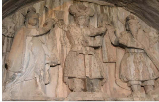
(شكل رقم ٧)

وهناك نقش آخر في نهاية طاق بستان على الجدار الخلفي منه، صوّرت فيه الإلهة آناهيتا وهي تمنح الغره الملكيّة، إذ نرى نقشين بارزين على طابقين، الطابق الأعلى هو منقوشة لمراسم تتويج الملك الساساني كسرى برويز (٥٩٠-٦٢٨م) من قبل الإله آهورامزدا بحضور الإلهة آناهيتا، ففي النّقش يظهر الملك واقفاً في الوسط يستلم حلقة الملوكيّة من يد آهورامزدا الذي يقف إلى يساره، وتقف آناهيتا خلف الملك، وهي تهدي حلقة الملوكيّة إليه (ينظر: شكل رقم ٧).